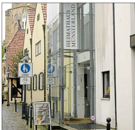
Einstimmig votierte gestern der Kulturausschuss des Kreises für den Start des Millionen-Projekts Museum Heimathaus Münsterland in Telgte.

So wurde gestern der Startschuss für ein Projekt gegeben, das in wirtschaftlich schwieriger Zeit auf eine „erstaunliche Finanzierung“ (Dr. Börger) verweisen kann: Die Sparkasse Münsterland Ost spendet 680 000 Euro (von den ursprünglich 750 000 Euro wurden schon 70 000 Euro für Vorlaufkosten verbraucht), der Kreis gibt 330 000 Euro, die Stadt Telgte ebenfalls 330 000 Euro, das Bistum Münster 260 000 Euro und der Landschaftsverband Westfalen Lippe bisher 700 000 Euro.